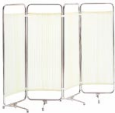
布製4つ折り B71-0244 外寸法/W450xH1800